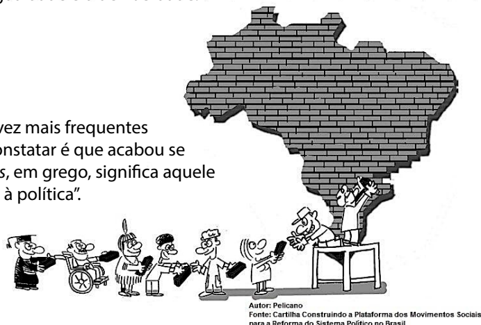
Autor: Pelicano

“O termo “idiota” aparece em comentários indignados, cada vez mais frequentes no Brasil, como “política é coisa de idiota”. O que podemos constatar é que acabou se invertendo o conceito original de idiota, pois a palavra idiótes , em grego, significa aquele que só vive a vida privada, que recusa a política, que diz não à política”. (M. S. Cortella e R. J. Ribeiro, Política - Para não ser idiota ).